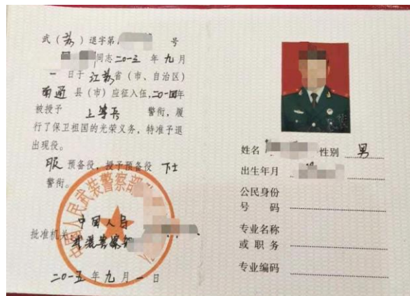
退出现役证照片示例